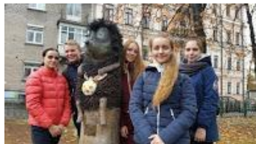
Англійськомовна екскурсія до м. Києва