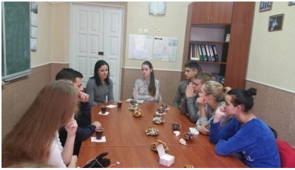
Зустріч з носієм англійської мови з Ірландії