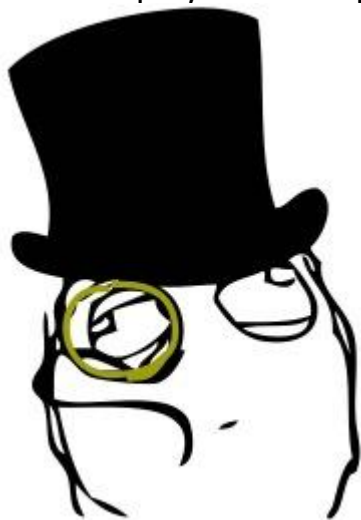
З повагою, редактор випуску Юлія Лисенко