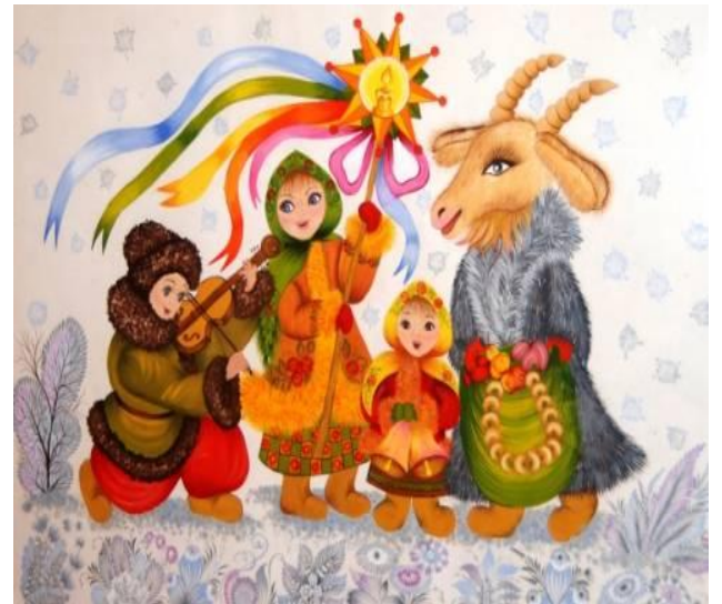
Рубрику підготувала: Дейнеко В., II фізико-математичний клас

«Щоб у вас і город родив, і товар плодив, і пшениця колосистая, і хазяйка голосистая!»