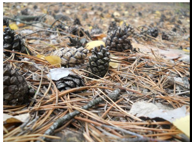
Рубрику підготувала Скляр Анастасія

Детальну інформацію можете прочитати на сайті ліцею ( http://www.ndu.edu.ua/liceum/ )